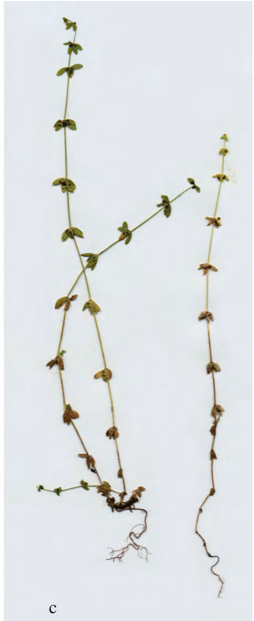
FIGURA 1. Detall dels (a) fruits, (b) les flors i (c) el port de Crucjata pedemontana .