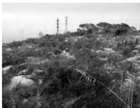
Figura 3. Restauració de dotze anys d'antiguitat al massís del Garraf (a dalt). Detall del paisatge natural del massís del Garraf (a baix).