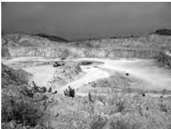
Figura 1. Afectacions de l'extracció de roca calcària.

tració competent decideixi si s'han assolit els objectius del programa de restauració. Això pot ser especialment complicat si cal fer-ho en terminis curts, ja que, un cop efectuades les actuacions incloses en el programa de restauració, aquests poden oscil·lar entre tres i cinc anys. L'existència d'eines que donin informació ràpida sobre l'estat de la recuperació pot facilitar aquest diagnòstic a curt termini, tant per als tècnics encarregats de fer l'avaluació com també per als mateixos tècnics de les explotacions.