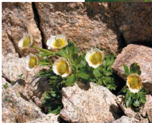
Ranunculus glacialis .